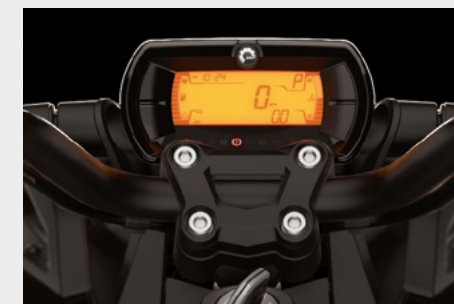
TABLEAU DE BORD NUMÉRIQUE : L'écran numérique 4,5 po au design minimaliste affiche toutes les données essentielles.

SYSTÈME UFIT : Se règle en un rien de temps en fonction de la taille et du style de conduite du pilote.