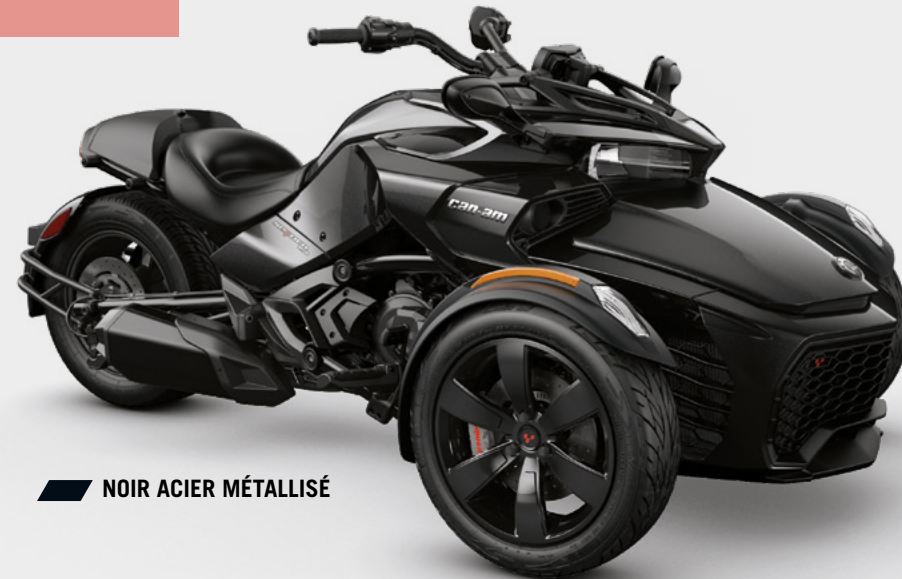
NOIR ACIER MÉTALLISÉ